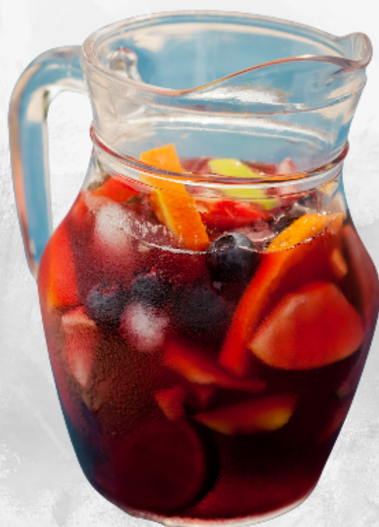
CLERICO VINO DE LA COLONIA