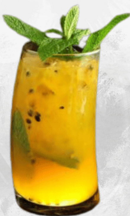
MOJITO DE MARACUYÁ CON NARANJA